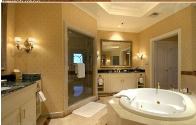
Гостиная и ванная комнаты