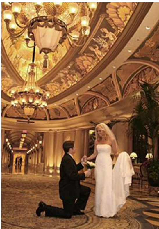
Один из холлов отеля