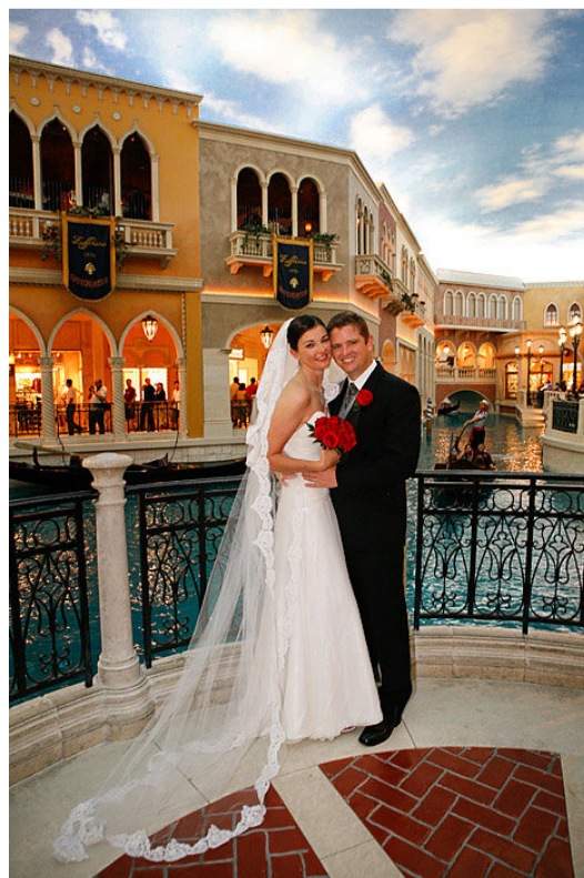
Канал внутри отеля