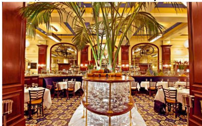
Ресторан Бушон (Bouchon)