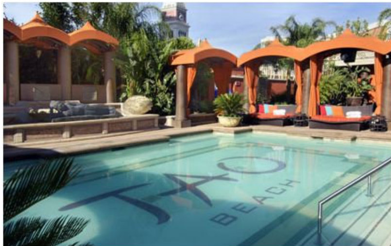
Один из бассейнов отеля. Ночной клуб Тао.

Canyon Ranch SPAclub - самый большой в городе SPA-салон, 62 процедурные комнаты.