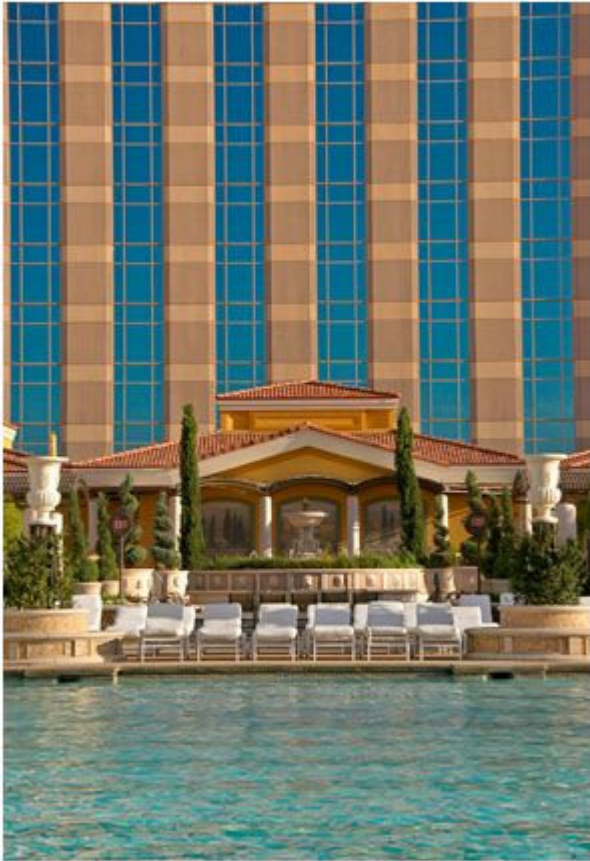
Один из бассейнов отеля